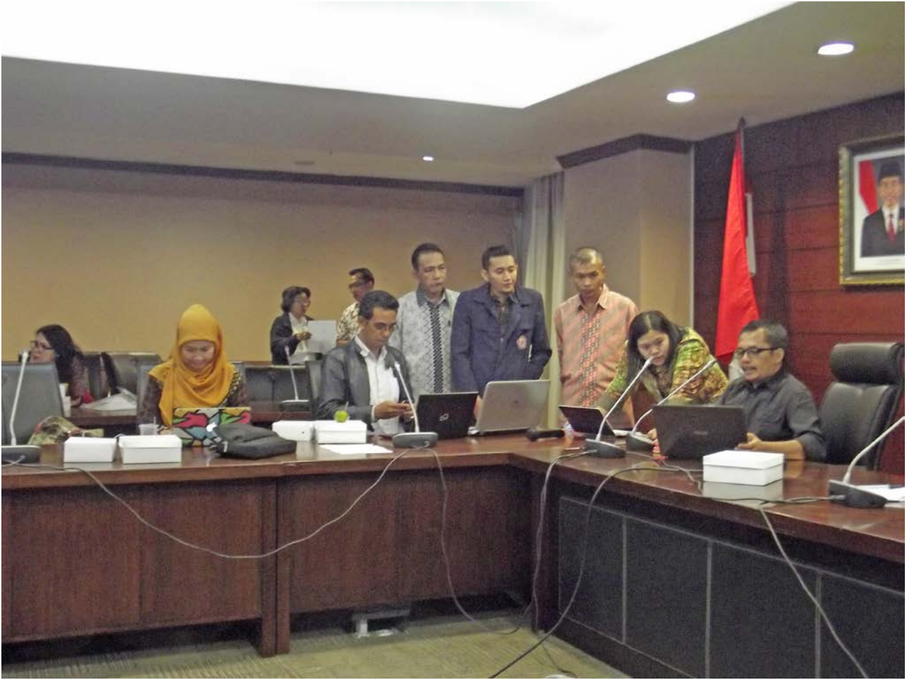
Foto 2: Kegiatan Bimtek AP2SG Perwakilan Kemendikbud Memberikan Konsultasi