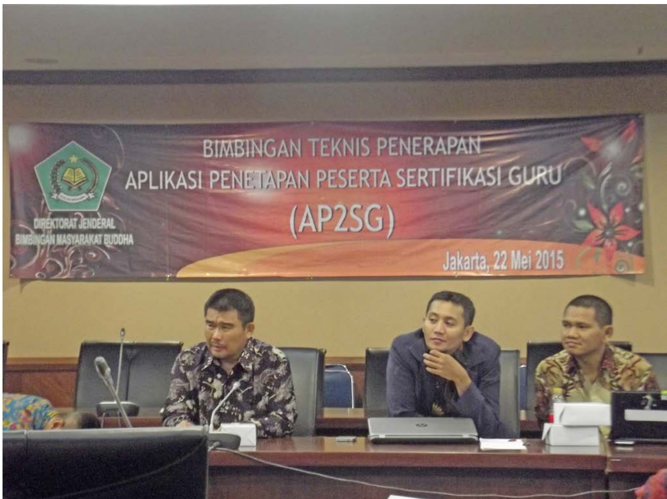
Foto 1: Kegiatan Bimtek AP2SG Perwakilan dari STABN Sriwijaya Tangerang Banten